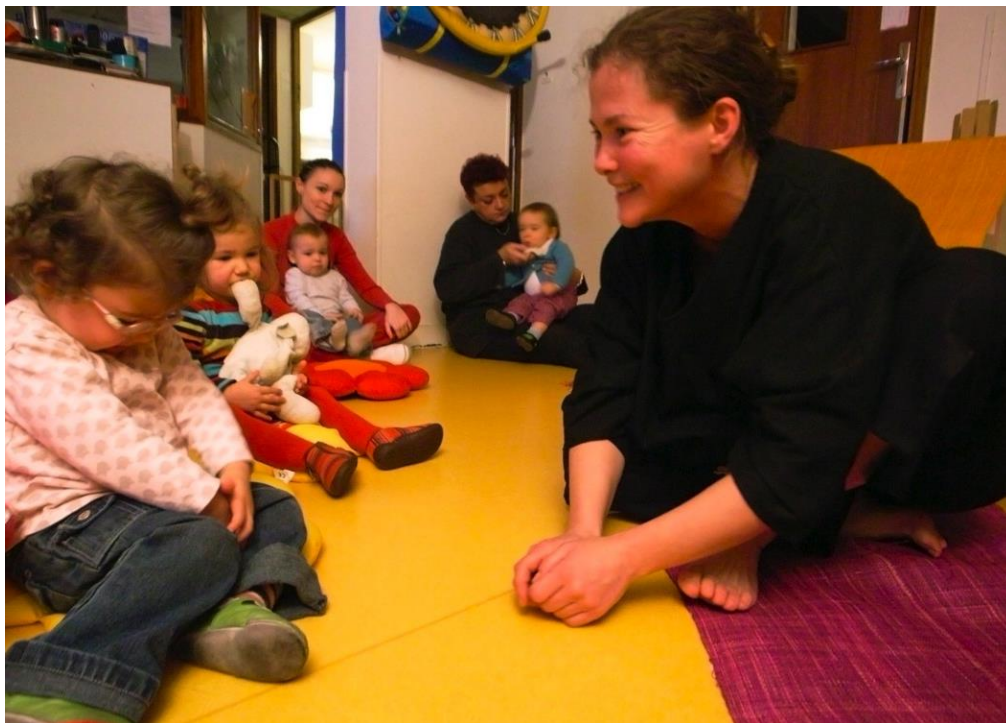
À la crèche « les pieds tendres ».