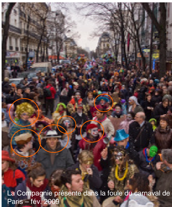
La Compagnie présente dans la foule du carnaval de Paris – fév. 2009