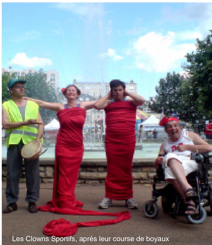
Les Clowns Sportifs, après leur course de boyaux

La Compagnie intervient dans l'ensemble de la région parisienne et dans toute la France selon les projets.