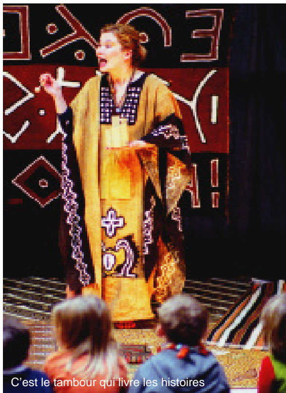
C'est le tambour qui livre les histoires

« Remarquable, excellent spectacle. Le ton est juste, merci beaucoup » Paul, à propos du spectacle « Angali Galitra, contes d'Afrique noire » à la comédie de la Passerelle, Juillet 09