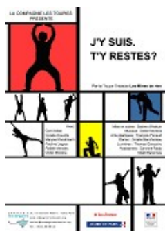
J'y suis. T'y restes ? 2014-2015

Depuis 2008 la troupe a créé cinq spectacles