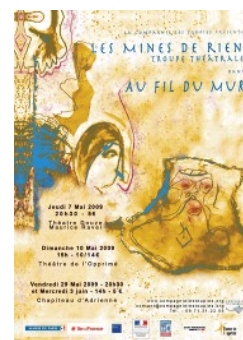
Au fil du mur 2008-2009