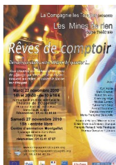
Rêves de comptoir 2010- 2011