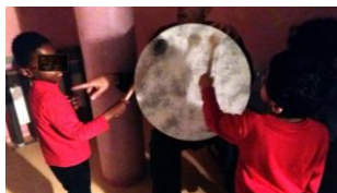
Photo d'une répétition avec les enfants porteurs de troubles autistiques de l'hôpital de jour Vacola 5 mai 2017

Les enfants explorent, jouent avec les éléments. Les artistes agissent en résonance avec les manifestations des enfants : sons, cris, mouvements, gestes, regards, jeux... Le contact peut être distant ou proche, doux ou plus appuyé, direct ou via les matériaux et instruments. Nous sommes ici dans la co-crédation de l'instant vécu .